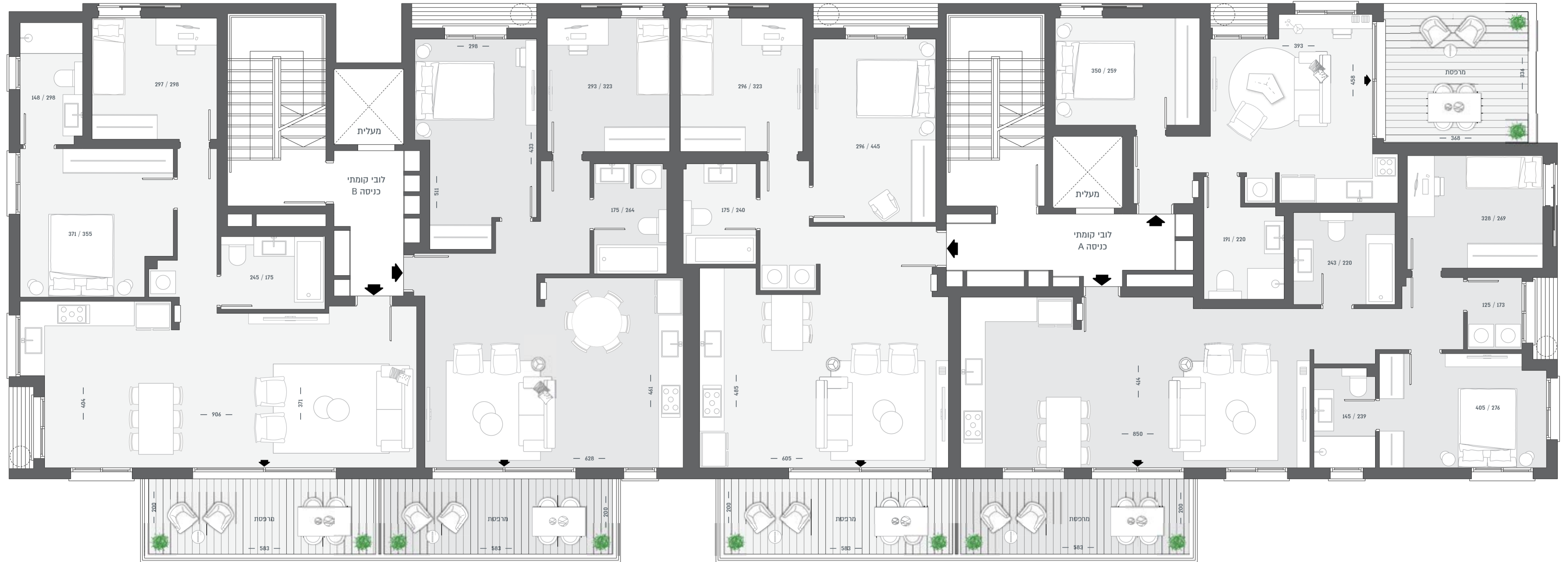
3 חדרים | D 74.5 מ"ר + 12 מ"ר מרפסת