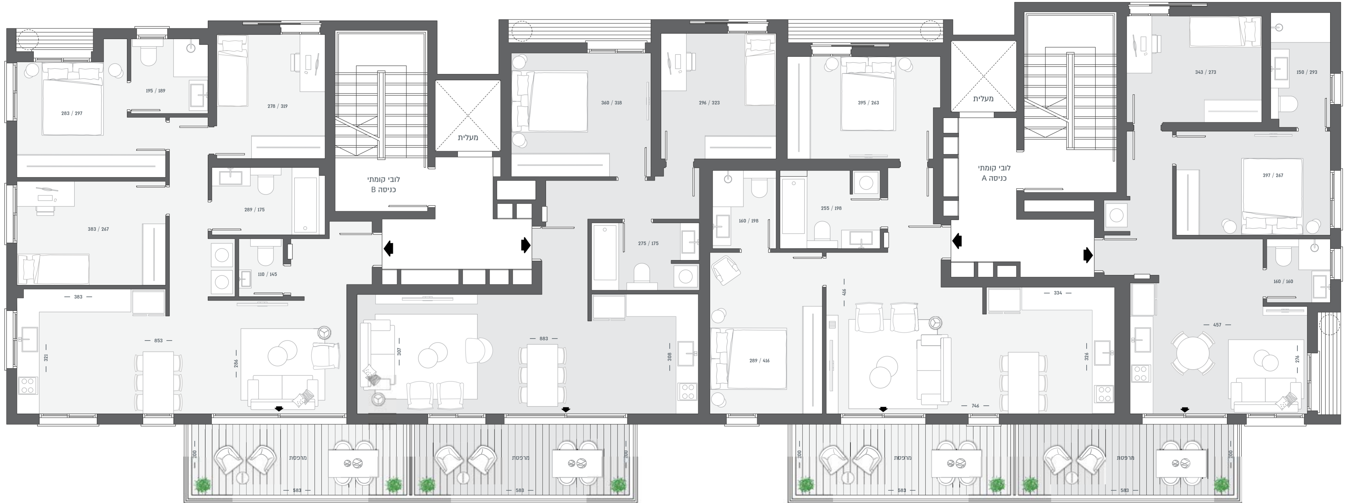
3 חדרים | J 73 מ"ר + 12 מ"ר מרפסת